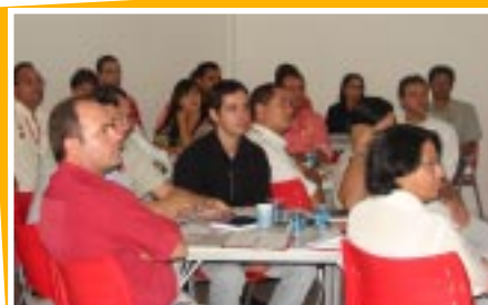
Colaboradores atentos ao treinamento