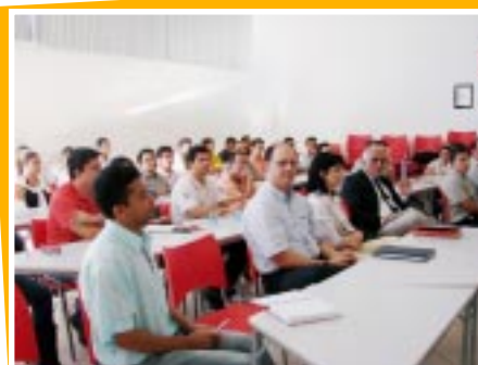
Encerramento da auditoria na Sala de Treinamento

Veja os nossos resultados no box abaixo: