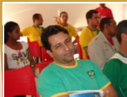
Troca de experiências entre a equipe

de tipos sanguíneos específicos. Em seguida, realizaram ação em posto de saúde para doação de sangue por parte da população. Muitos funcionários da Uberlândia Refrescos participaram e deram um grande exemplo.