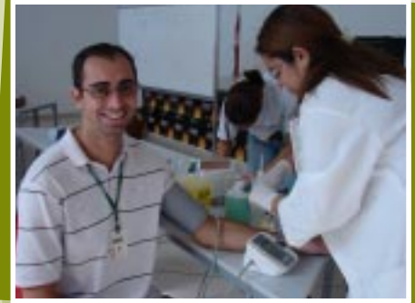
Funcionário durante o exame

Em andamento na Uberlândia Refrescos, e em parceria com o SESI, o "Diagnóstico de Saúde e Estilo de Vida". Este trabalho proporcionará identificar doenças não transmissíveis (DNT) como diabetes, hipertensão arterial, obesidade, entre outras, e que acidentes e doenças relacionadas ao trabalho têm grande impacto sobre a saúde dos colaboradores, acarretando perdas na produtividade. O projeto está sendo realizado por dentistas, enfermeiros e profissionais de educação física.