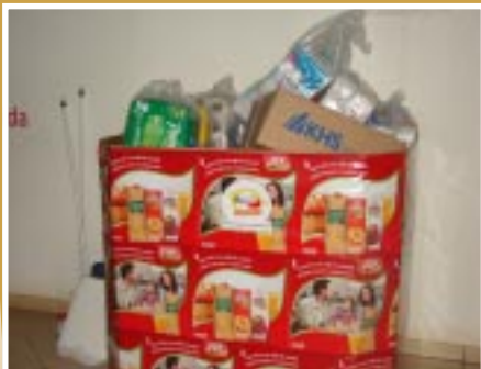
Uma das caixas de arrecadação distribuídas pela empresa

A arrecadação e o dia da ação foram um sucesso! Urlação Voluntária, em sua 8ª edição, foi recorde de arrecadação. Esta foi a maior das movimentações já feitas por funcionários da Uberlândia Refrescos em conjunto com empresas apoiadoras. Foi arrecadada mais de 1 tonelada de mantimentos, dentre eles, 136 caixas de leite, mais de 1.000 rolos de papel higiênico, 100 sabonetes, 60 kits de material escolar, 20 pacotes de fralda, 04 kits completos de material de limpeza,