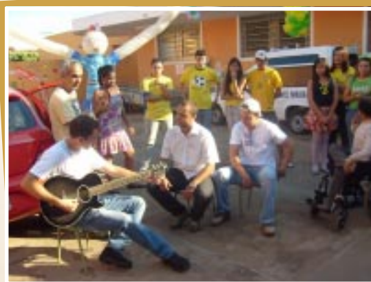
Colaboradores da Uberlândia Refrescos animam o Núcleo Maria de Nazaré

Já em Ituiutaba, a ação aconteceu no mês de julho. A equipe organizou palestra de conscientização da importância da doação de sangue, a realidade do HEMOMINAS e a carência