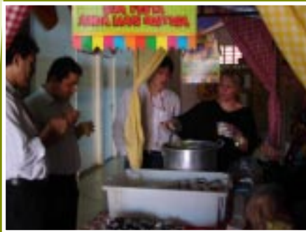
Comemoração de São João

No dia de São João, os colaboradores da Uberlândia Refrescos, Uberlândia, foram surpreendidos com barraquinhas de comidas típicas das festas juninas. No friozinho da manhã, os colaboradores puderam se es-